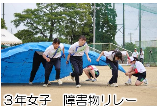
3年女子 障害物リレー