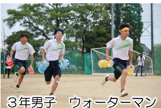
3年男子 ウォーターマン