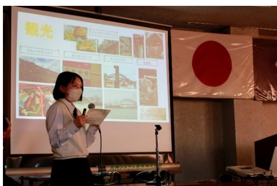
訪れた場所や日本との文化の違いについて発表しました