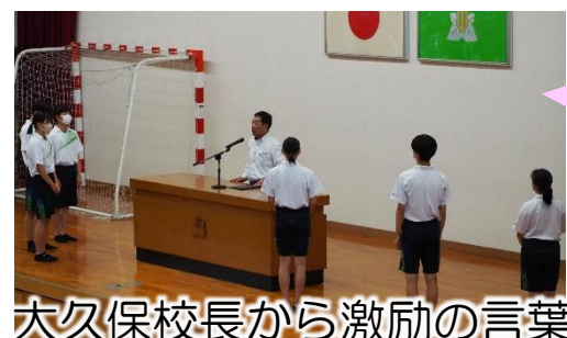
大久保校長から激励の言葉