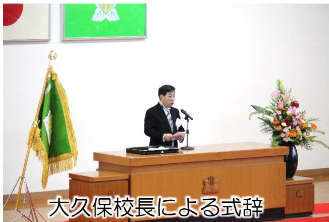
大久保校長による式辞