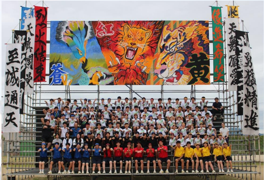
高校生活最後の大運動会を終えた3年生

6月10日(土)、第25回山門高校大運動会を開催しました。今年の大会テーマは「縁進希笑(えんしんきしょう)～創り上げろ! 誰もが見たことのない時代～」です。このテーマのそれぞれの文字には、縁…一人ひとりが誰かと出会い、関係を築くことは素晴らしいこと。進…そんな素晴らしい人や環境とともに前へ前へと進もう。希…心から実現させたいという想い。笑…最後は、全員が笑って終われるように。という想いが込められています。