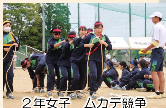
2年女子 ムカデ競争