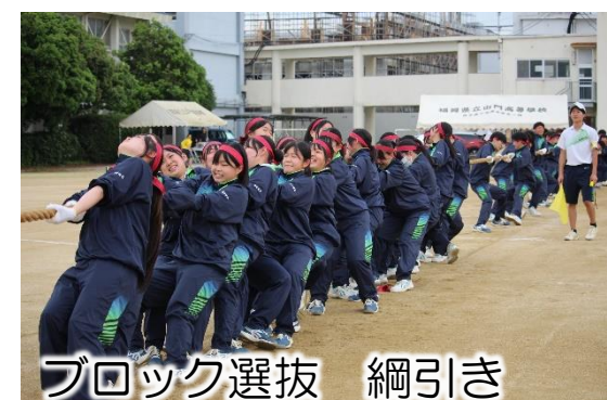
ブロック選抜 綱引き