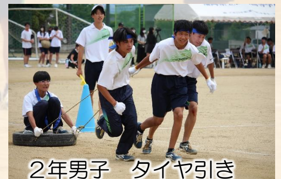
2年男子 タイヤ引き